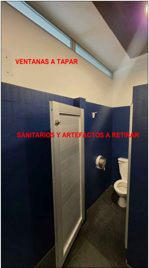
VENTANAS A TAPAR