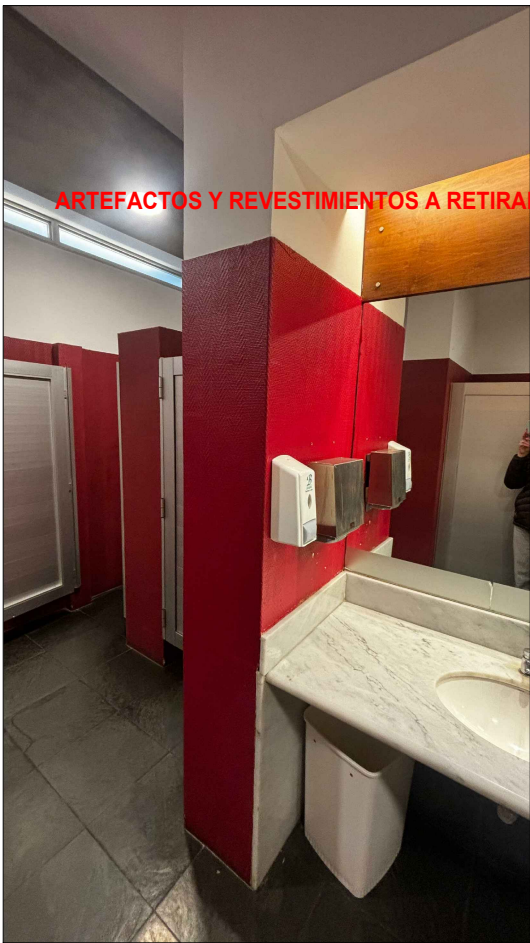
ARTEFACTOS Y REVESTIMIENTOS A RETIRAR