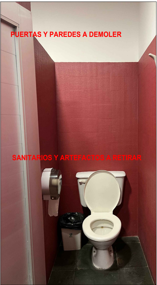
PUERTAS Y PAREDES A DEMOLER