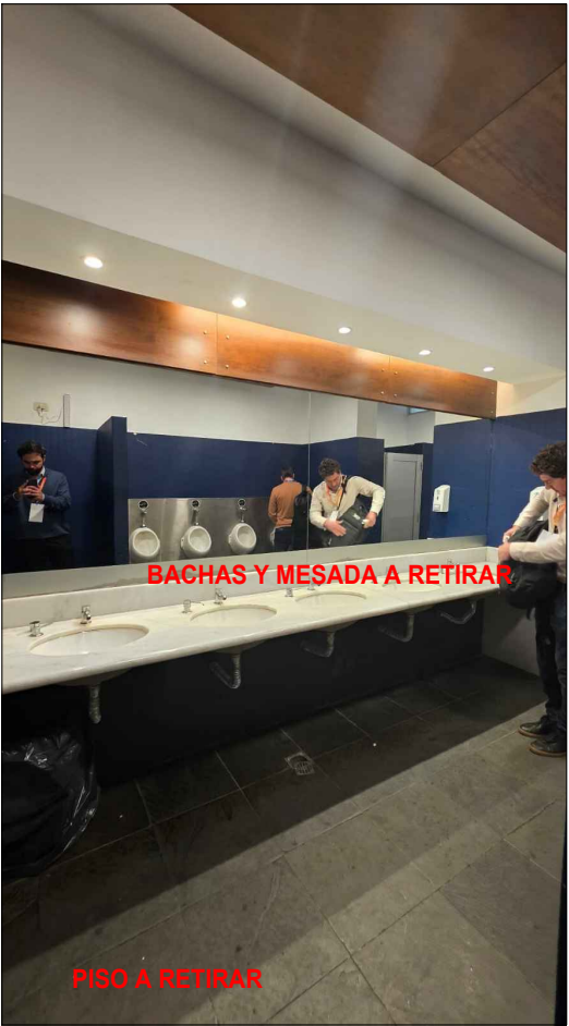
BACHAS Y MESADA A RETIRAR