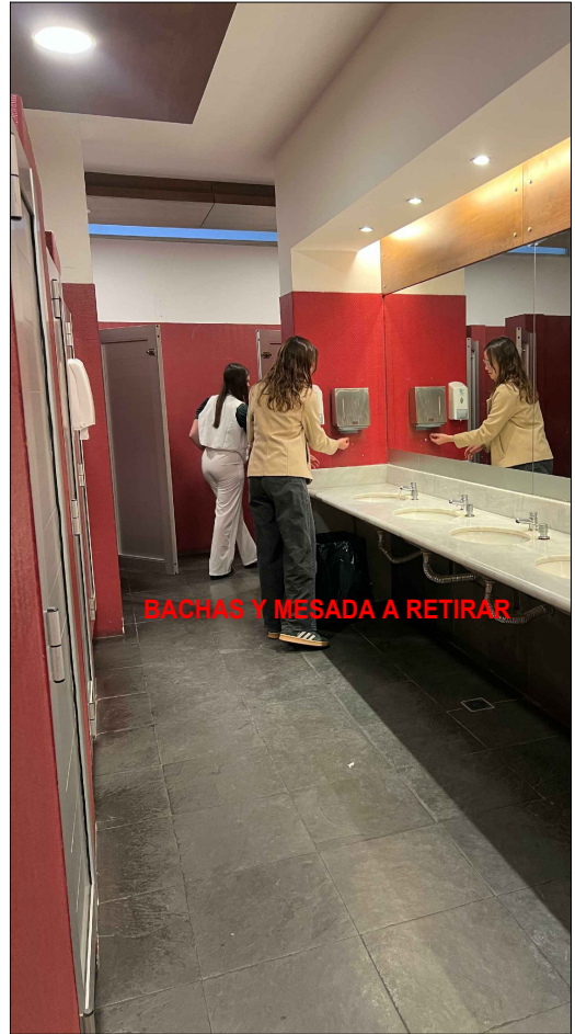
BACHAS Y MESADA A RETIRAR