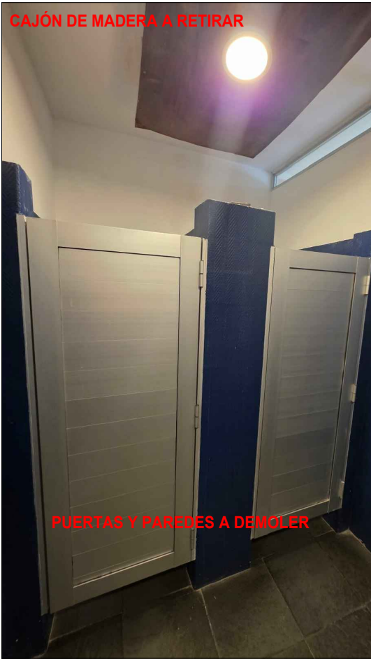
CAJÓN DE MADERA A RETIRAR