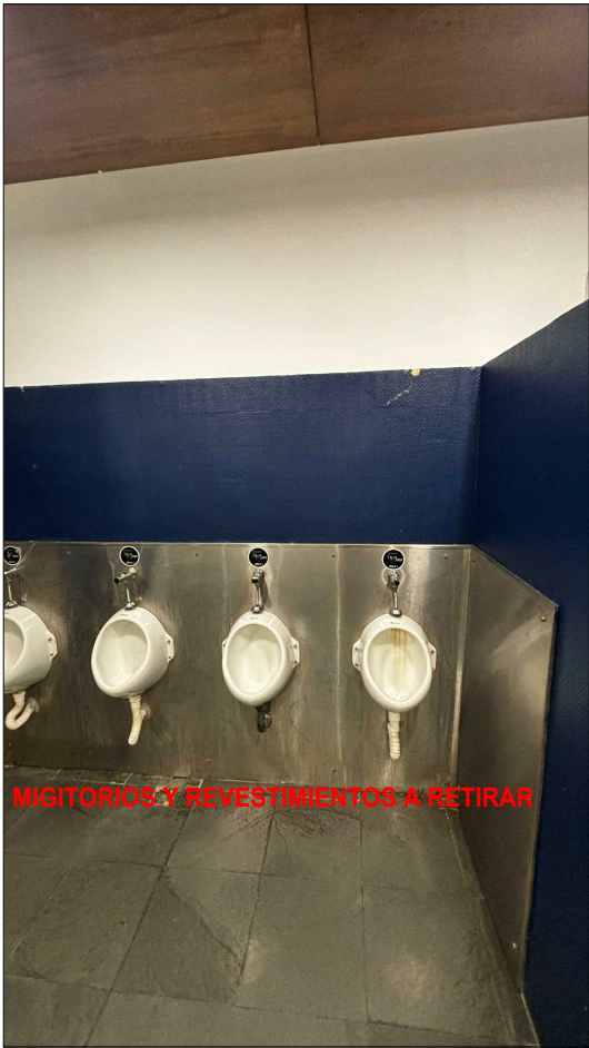
MIGITORIOS Y REVESTIMIENTOS A RETIRAR